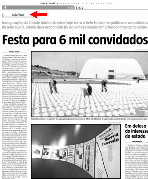
Figura 5 – Primeiro clichê: Página 4 do EM

Ainda no EM, a segunda edição sofreu significativas alterações. A reportagem principal da página 4, que antes era sobre os preparativos da inauguração da Cidade Administrativa, agora é a repercussão do editorial; “Em defesa dos interesses de Minas” (ARANHA, 2010a, grifos nossos). A reportagem “Festa para 6 mil convidados” foi transferida para a página 11. Vale mencionar, também, a mudança de selo que na primeira edição era “Governo” e na segunda “Eleições”. Assim, a matéria de repercussão do editorial ganhou mais destaque na 2ª edição e foi associada ao tema “Eleições”, confirmando que se tratava de uma questão eleitoral, ou seja, da candidatura de Aécio Neves.