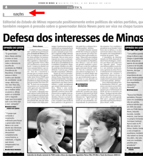
Figura 6 – Segundo clichê: Página 4 do EM