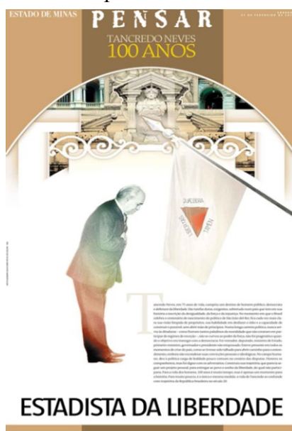
Figura 1 - “Estadista da liberdade”

O caderno especial do EM traz um histórico de Tancredo, com ênfase em suas habilidades políticas e sua notoriedade nacional. O enquadramento é o “centrado na personalidade”, com ênfase na “habilidade política” de Tancredo.