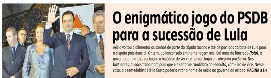
Figura 2 – “O enigmático jogo do PSDB para a sucessão e Lula”

No dia 2 de março, no jornal EM, o texto da chamada da capa especula sobre a possibilidade de Aécio formar chapa com Ciro, após ele ter recusado ser vice de Serra.