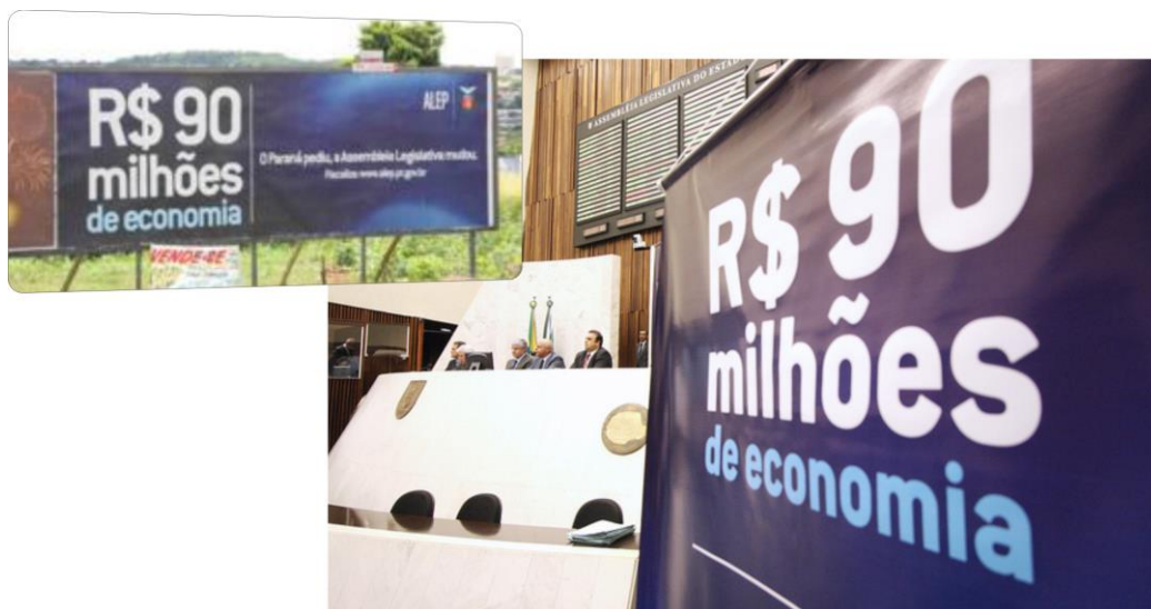
Imagem 01 – Outdoor e banner no plenário da Assembleia