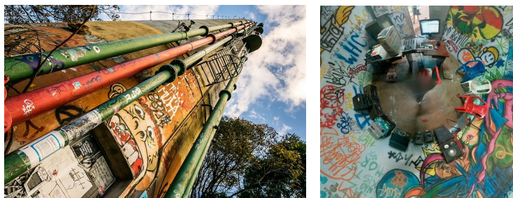
Arquivo: Rádio Muda.