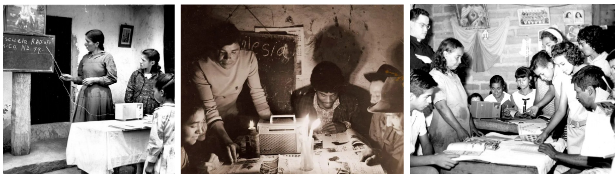
Figuras 1 – 2 – 3 – Sistema Educativo Sutatenza

A rede de escolas radiofônicas Sutatenza, na Colômbia, em 1947, é um projeto reconhecido internacionalmente, um patrimônio da humanidade justamente por permitir a participação social que marcará o ideal de construção dos projetos de rádio comunitária em todo o mundo ao longo das últimas décadas. Um projeto voltado para os moradores de áreas rurais que se utilizou de material didático combinado, de cartilhas e aulas radiofônicas, reduzindo com grande sucesso os altos índices de analfabetismo no país. Um sistema de rádio que operava em diferentes frequências e viabilizava uma educação oficial e eficaz à distância.